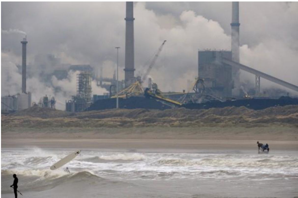
Strand Noordpier Velsen-Noord, IJmond