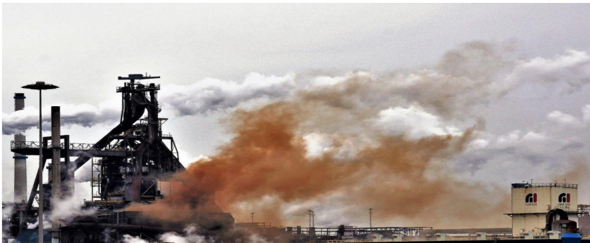
Tata steel, IJmuiden

Over de bevindingen gaan we in gesprek met beleidsmakers, politici, bewoners, ondernemers, medici, juristen, technici, én de betrokken bedrijven.