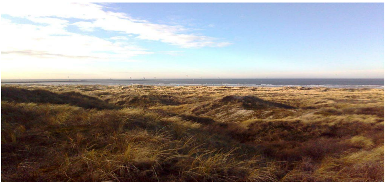
Grijze duinen, Noordhollands Duinreservaat, IJmond